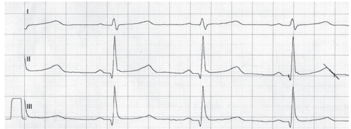
Рис. 1. ЭКГ от 02.03.2011. QT 438 мсек, QTc 472 мсек, RR 862 мсек.

Электрокардиограмма (ЭКГ) покоя – синусовая брадиаритмия с ЧСС от 56 до 72 в мин, интервал QTc 472 мсек (рис. 1). В архивных ЭКГ выявлены как удлиненные, так и нормальные интервалы QTc, во многом связанные с вариативностью RR интервалов без нарушений реполяризации левого желудочка. На рисунке 2 видно, что интервалы QTc существенно меняются от нормальных до значительно увеличенных в зависимости от изменений RR интервалов, которые могут быть связаны с миграцией водителя ритма по предсердиям. Становится очевидным, что формула Базетта не работает при имеющейся, нередко, аритмии у спортсменов. Расчет среднего интервала QTc на