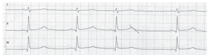
Рис. 2. ЭКГ от 10.09.2007. Во 2–4 кардиоциклах интервалы QT 500, 500, 520 мсек, интервалы QTc – 460, 516 и 424 мсек соответственно.

данной ЭКГ (467 мсек) вряд ли следует признать надежным.